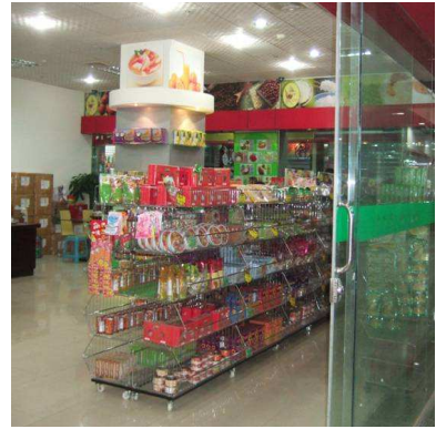
“ศูนย์กระจายสินค้าไทยในคูหนมิง”

ส่วนวิจัยธุรกิจ 2 ฝ่ายวิจัยธุรกิจ สิงหาคม 2553