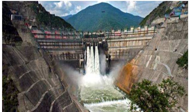
“โครงการเขื่อนผลิตกระแสไฟฟ้าขนาดใหญ่”

✓ ธุรกิจโรงไฟฟ้าพลังน้ำ เนื่องจากสภาพภูมิประเทศส่วนใหญ่ของยูนนานเป็นแนวเทือกเขาและมีแม่น้ำน้อยใหญ่ไหลผ่านกว่า 600 สาย แม่น้ำสายสำคัญ อาทิ แม่น้ำ Yiluowadi Jiang (แม่น้ำอิระวดี) และแม่น้ำ Lanchang Jiang (แม่น้ำโขง) เป็นต้น ส่งผลให้ยูนนานมีศักยภาพเหมาะสมในการสร้างเขื่อนผลิตกระแสไฟฟ้าและยังมีบทบาทสำคัญในการเป็นผู้ผลิตและผู้จำหน่ายกระแสไฟฟ้ารายใหญ่ให้กับพื้นที่ขาดแคลนไฟฟ้าอย่างมณฑลกว๋างตุ้ง จึงเป็นโอกาสของนักลงทุนไทยในการเข้าไปลงทุนในธุรกิจโรงไฟฟ้าและบริการที่เกี่ยวข้อง ทั้งนี้ ปัจจุบันมีนักลงทุนไทยที่เข้าไปลงทุนในธุรกิจดังกล่าว อาทิ บริษัท Union Energy (China) Co., Ltd. ซึ่งเป็นบริษัทย่อยของกลุ่มสหยูเนียนร่วมทุนกับจีนเพื่อตั้งโรงไฟฟ้าพลังน้ำ 2 แห่งในยูนนาน