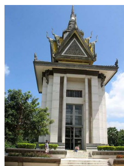
อนุสรณ์รำลึกถึงความโหดร้ายของการฆ่าล้างเผ่าพันธุ์ที่ทุ่งสังหาร

• รัฐบาลกัมพูชามีนโยบายส่งเสริมการลงทุนในอุตสาหกรรมท่องเที่ยว โดยนอกจากสิทธิประโยชน์พื้นฐานที่นักลงทุนต่างชาติจะได้รับจาก The Cambodian Investment Board (CIB) เช่น การยกเว้นภาษีเงินได้นิติบุคคลตามระยะเวลาที่กำหนด และการโอนเงินตราต่างประเทศได้อย่างเสรีแล้ว นักลงทุนต่างชาติที่เข้ามาลงทุนในธุรกิจท่องเที่ยวและบริการที่เกี่ยวข้องบางโครงการ อาทิ การก่อสร้างโรงแรมระดับ 3 ดาวขึ้นไป และการก่อสร้างสิ่งอำนวยความสะดวกด้านการท่องเที่ยว ยังสามารถขอรับ