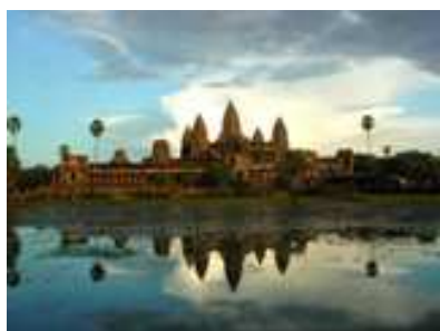
นครวัด 1 ใน 7 สิ่งมหัศจรรย์ของโลก

• กัมพูชามีสถานที่ท่องเที่ยวหลากหลาย สามารถตอบสนองความต้องการของนักท่องเที่ยวได้เป็นอย่างดี ทั้งแหล่งท่องเที่ยวทางประวัติศาสตร์และวัฒนธรรม โดยเฉพาะโบราณสถานซึ่งได้รับการจัดเป็นมรดกโลก เช่น “นครวัด-นครธม” ในจังหวัดเสียมราฐ ซึ่งมีนักท่องเที่ยวต่างชาติเดินทางมาเยี่ยมชมรวม 1 ล้านคนในช่วง 11 เดือนแรกของปี 2550 รวมทั้งแหล่งท่องเที่ยวทางประวัติศาสตร์การเมืองที่มีชื่อเสียงลือลั่นไปทั่วโลก คือ ทุ่งสังหาร (Killing Fields) ในกรุงพนมเปญ นอกจากนี้ กัมพูชายังมีแหล่งท่องเที่ยวทางธรรมชาติที่หลากหลายและยังอยู่ในสภาพสมบูรณ์ ไม่ว่าจะเป็นชายหาดและแนวปะการังในกรุงสีหนุวิลล์ ตลอดจนแหล่งท่องเที่ยวเชิงนิเวศน์ในบริเวณภาคตะวันออกเฉียงเหนือ ซึ่งเน้นรองรับกลุ่มนักท่องเที่ยวที่ชอบการผจญภัย