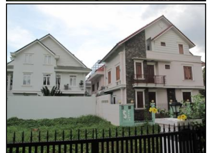
คอนโดมิเนียมและบ้านสมัยใหม่ ในเขตเมืองใหม่ในนครโฮจิมินห์