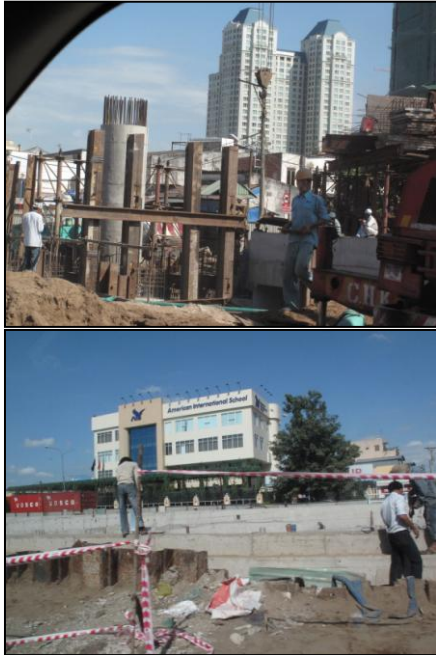
โครงการก่อสร้างสะพานและถนน ในนครโฮจิมินห์

ท่ามกลางแรงกดดันทางเศรษฐกิจทั้งจากภายในประเทศและนอกประเทศ ในปีที่ผ่านมา ภาคการก่อสร้าง ถือเป็นแรงขับเคลื่อนสำคัญต่อการขยายตัวทางเศรษฐกิจ ของเวียดนาม มควบคู่ไปกับการบริโภคในประเทศที่ ยังเติบโตในเกณฑ์ดี โดยในปี 2552 ภาคการก่อสร้างของเวียดนามขยายตัวสูงถึง ร้อยละ 11.4 ขณะที่ภาคเศรษฐกิจหลักอื่นๆ ทั้งภาคเกษตรกรรม ภาคการผลิต และภาคบริการ ต้อง ประสบภาวะชะงักงัน ทั้งนี้ ภาคการก่อสร้างของเวียดนาม ที่ขยายตัว อย่างโดดเด่น ส่วนหนึ่ง เป็นผลจาก มาตรการอัดฉีดเงินเพื่อ อกระตุ้นเศรษฐกิจของรัฐบาลเวียดนาม ซึ่งรวมถึง มาตรการสนับสนุนธนาคารพาณิชย์ในการปล่อยสินเชื่อ และดำเนินนโยบาย อัตราดอกเบี้ยต่ำ นอกจากนี้ ภาคการก่อสร้าง ยังได้รับ อานิสงส์จากราคาวัสดุ และ อุปกรณ์ก่อสร้างที่ปรับลดลงมาก ตามความต้องการที่ลดลงในตลาดโลก