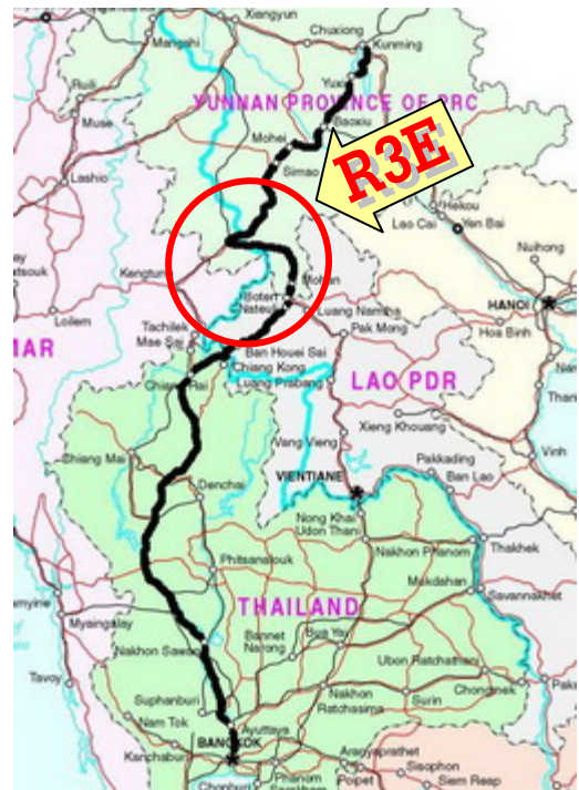
ภาพแสดงเส้นทาง R3E

เส้นทาง R3E ใน สปป.ลาว ระยะทางราว 228 กิโลเมตร มีจุดเริ่มต้นที่กิโลเมตรที่ 0 (ห่างจากปลายสะพานข้ามแม่น้ำโขง แห่งที่ 4 ฝั่ง สปป.ลาว ประมาณ 5.41 กิโลเมตร) ต่อไปยัง ➡ กิโลเมตรที่ 84 บ้านสอต แขวงบ่อแก้ว ระยะทางประมาณ 85 กิโลเมตร ➡ กิโลเมตรที่ 159 บ้านน้ำลิ่ง แขวงหลวงน้ำทา ระยะทางประมาณ 74 กิโลเมตร (พื้นที่มีลักษณะเป็นภูเขาสูงจึงต้องก่อสร้างถนนเลียบบตามไหล่เขาเป็นหลัก ใช้เวลาเดินทางประมาณ 3 ชั่วโมง 30 นาที หรือเฉลี่ยประมาณ 21 กิโลเมตรต่อชั่วโมง) ➡ ด่านบ่อเต็น ระยะทางประมาณ 69 กิโลเมตร (พื้นที่ส่วนใหญ่เป็นที่ราบสูง ใช้เวลาเดินทางประมาณ 1 ชั่วโมง) อยู่ติดกับชายแดนจีนที่บ่อหาน (มณฑลยูนนาน)