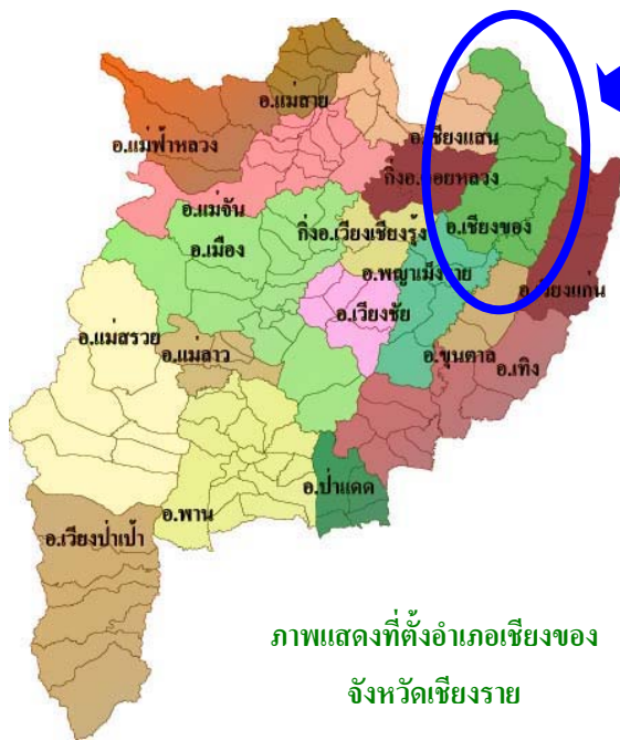
ภาพแสดงที่ตั้งอำเภอเชียงของ จังหวัดเชียงราย

อำเภอเชียงของ จังหวัดเชียงราย อยู่บริเวณริมฝั่งแม่น้ำโขงห่างจากอำเภอเมือง จังหวัดเชียงรายราว 114 กิโลเมตร ตามทางหลวงหมายเลข 1129 (เชียงแสน - เชียงของ) เป็นพื้นที่ที่อยู่ในโครงการพัฒนาเขตเศรษฐกิจพิเศษจังหวัดเชียงราย ภายใต้แผนยุทธศาสตร์เมืองชายแดนของประเทศไทย เพื่อรองรับยุทธศาสตร์ที่จะเชื่อมโยงเส้นทางการค้าการลงทุน และการท่องเที่ยวของกลุ่มประเทศในอนุภูมิภาค ลุ่มน้ำโขงเข้าด้วยกัน