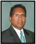
Mohammed Waheed Hassan

เข้าดำรงตำแหน่ง : พฤศจิกายน 2551 สิ้นสุดวาระ : กุมภาพันธ์ 2555