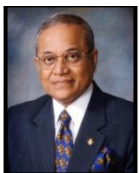
Maumoon Abdul Gayoom

เข้าดำรงตำแหน่ง : พฤศจิกายน 2521 สิ้นสุดวาระ : พฤศจิกายน 2551