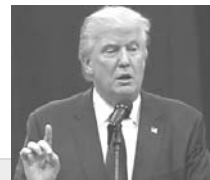
นายโดนัลด์ ทรัมป์ ตัวแทนจากพรรครีพับลิกัน