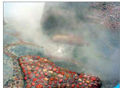
น้ำพุร้อน Jinping Mengla ในยูนนาน

ธุรกิจสปา/นวดแผนไทย ปัจจุบันสปาไทยเป็นที่รู้จักและเป็นที่นิยมอย่างมากในจีน โดยเฉพาะในคุนหมิง เนื่องจากเอกลักษณ์ในด้านการใช้สมุนไพรที่หลากหลายและการให้บริการที่อ่อนน้อมและเป็นมิตร ซึ่งสามารถผสมผสานเข้ากับทรัพยากรด้านการท่องเที่ยวของยูนนานที่มีความสวยงามตามธรรมชาติ โดยเฉพาะมีบ่อน้ำพุร้อนที่มีชื่อเสียงจำนวนมาก ทั้งนี้ ผู้ประกอบการไทยอาจเริ่มต้นธุรกิจด้วยการเปิดให้บริการสปาในโรงแรม เนื่องจากเป็นแหล่งที่มีกลุ่มลูกค้าที่ต้องการใช้บริการอยู่แล้ว