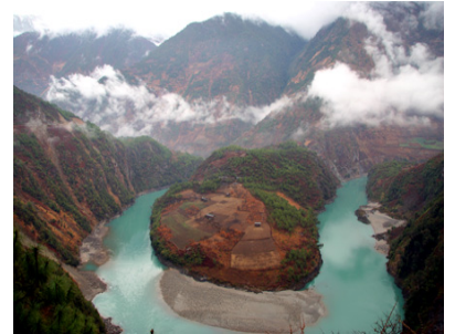
ทิวทัศน์อันงดงามบริเวณดินแดนแม่น้ำสามสาย