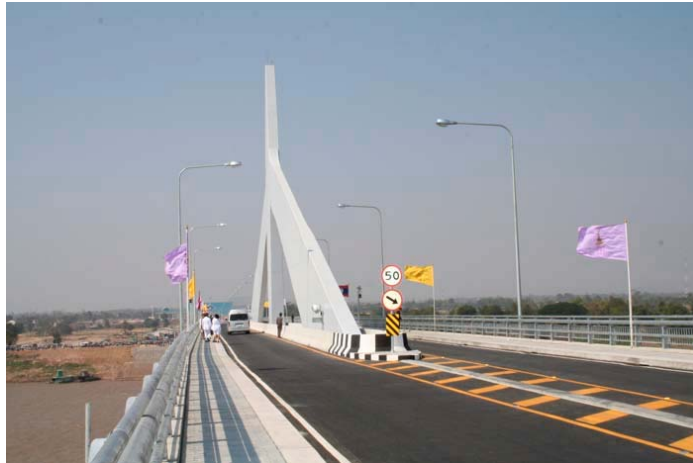
ภาพที่ 2 : สภาพถนนบนสะพานมิตรภาพไทย- สปป.ลาว แห่งที่ 2