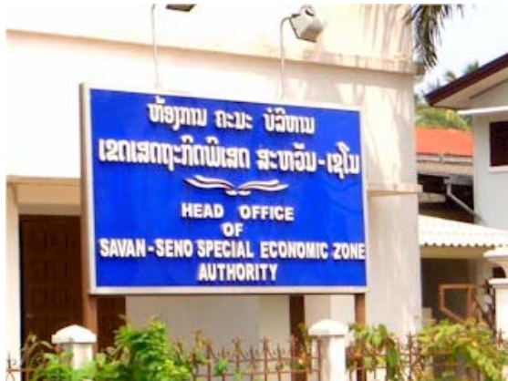
ภาพที่ 4-5 : เขตเศรษฐกิจพิเศษสะหวัน - เซโน

• โครงการเมืองสะหวัน (Savan City) เป็นโครงการพัฒนาพื้นที่ 2,680 ไร่ ในแขวงสะหวันนะเขต อยู่ใกล้กับสะพานมิตรภาพไทย- สปป.ลาว แห่งที่ 2 โดยด้านหนึ่งของพื้นที่อยู่ติดแนวแม่น้ำโขง ส่วนอีกด้านหนึ่งอยู่ติดกับเส้นทางหมายเลข 9 ทั้งนี้ เมื่อวันที่ 12 ธันวาคม 2549 บริษัท ไทย แอร์พอร์ตส์ กราวด์เซอร์วิสเชส จำกัด (แท็คส์) ได้ลงนามในบันทึกความเข้าใจร่วมกับรัฐบาล สปป.ลาว ในการเข้าเป็นผู้รับผิดชอบพัฒนาโครงการเมืองสะหวัน เพื่อพัฒนาพื้นที่ดังกล่าวให้เป็นเมืองเศรษฐกิจที่ครบวงจร โดยแท็คส์จะลงทุนร้อยละ 70 ของโครงการ (เงินลงทุนประมาณ 1,370 ล้านบาท) ส่วนที่เหลืออีกร้อยละ 30 (ประมาณ 587 ล้านบาท) เป็นการลงทุนจากรัฐบาล สปป.ลาว ซึ่งคาดว่าจะใช้เวลาพัฒนาโครงการดังกล่าวให้เสร็จสมบูรณ์ไม่เกิน 10 ปี นับตั้งแต่ปี 2550 เป็นต้นไป