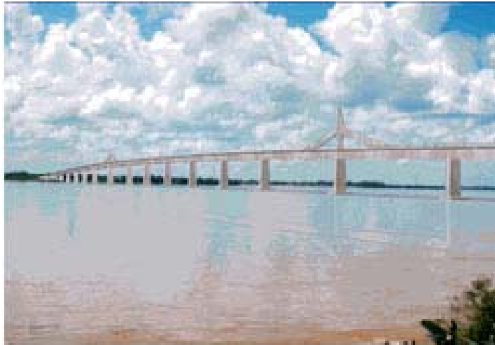
ภาพที่ 1 : ภาพมุมกว้างของสะพานมิตรภาพไทย- สปป.ลาว แห่งที่ 2

(JICA) ให้ความช่วยเหลือในการสำรวจและออกแบบสะพาน ทั้งนี้ รัฐบาลไทยและรัฐบาล สปป.ลาว ได้ร่วมลงนามในข้อตกลงก่อสร้างสะพานมิตรภาพไทย- สปป.ลาว แห่งที่ 2 เมื่อเดือนมีนาคม 2544 และได้ร่วมลงนามในสัญญากู้เงินจากธนาคารเพื่อความร่วมมือระหว่างประเทศญี่ปุ่น (Japan Bank for International Cooperation : JBIC) เพื่อใช้ในการก่อสร้าง มูลค่ารวมราว 8,090 ล้านบาท (หรือประมาณ 2,588 ล้านบาท) เมื่อเดือนธันวาคม 2544 โดยฝ่ายไทยและฝ่าย สปป.ลาว จะรับผิดชอบค่าใช้จ่ายฝ่ายละครึ่งหนึ่งของเงินลงทุนทั้งหมด