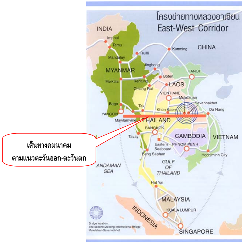
ภาพที่ 3 : โครงข่ายการคมนาคมตามแนวตะวันออก-ตะวันตก