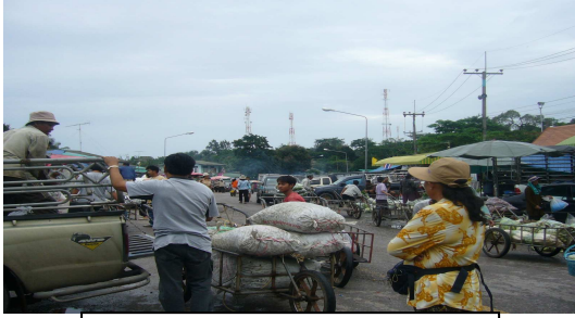
ด่านบ้านหาดเล็ก ชายแดนฝั่งไทย