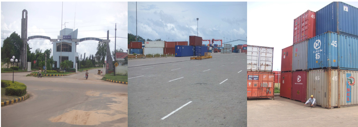
บริเวณโดยรอบท่าเรือสีหนุวิลล์

กรุงสีหนุวิลล์ กรุงสีหนุวิลล์เปรียบเสมือนแผ่นดินเพชรของกัมพูชา เนื่องจากเป็นที่ตั้งของท่าเรือสีหนุวิลล์ ซึ่งเป็นท่าเรือน้ำลึกทางทะเลขนาดใหญ่แห่งเดียวของประเทศและมีความทันสมัยที่สุด มีศักยภาพในการรองรับการขนส่งสินค้าได้ถึง 1.6 ล้านตันต่อปี และสามารถรองรับการขนส่งสินค้าระหว่างประเทศได้มากถึงร้อยละ 70 ของการค้าระหว่างประเทศทั้งหมด ท่าเรือสีหนุวิลล์จึงเป็นศูนย์กลางกระจายสินค้าที่สำคัญที่สุดของกัมพูชา นักลงทุนไทยสามารถเข้าไปลงทุนในธุรกิจบริการด้านคลังสินค้า การขนส่งสินค้า โดยเฉพาะอาหารทะเลสดที่มีมากในพื้นที่และส่วนใหญ่จะส่งไปยังกรุงเทพมหานคร นอกจากนี้ ยังมีโอกาสเข้าไปลงทุนในธุรกิจโรงน้ำแข็งและห้องเย็น ซึ่งจำเป็นต้องใช้ในการจัดเก็บสินค้า เพื่อคงความสดและป้องกันไม่ให้เน่าเสีย รวมถึงบริการจุดพักรถในบริเวณ Rest Areas ตามแนวถนน เช่น ปั๊มน้ำมัน ร้านอาหารและน้ำดื่ม ทั้งนี้ การเดินทางจากตัวจังหวัดเกาะกง-กรุงสีหนุวิลล์ มีระยะทางราว 235 กิโลเมตร ใช้เวลาเดินทางราว 3-4 ชั่วโมง