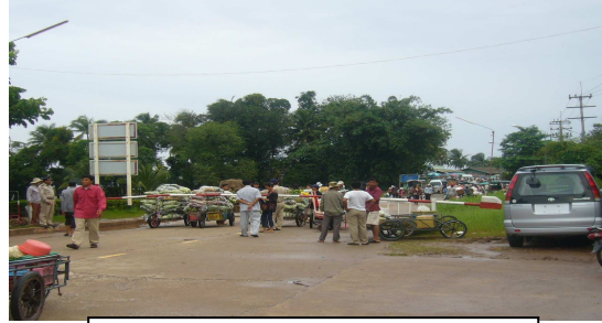
ด่านบ้านจามเขียม ชายแดนฝั่งกัมพูชา

กรุงสีหนุวิลล์ กรุงสีหนุวิลล์เปรียบเสมือนแผ่นดินเพชรของกัมพูชา เนื่องจากเป็นที่ตั้งของท่าเรือสีหนุวิลล์ ซึ่งเป็นท่าเรือน้ำลึกทางทะเลขนาดใหญ่แห่งเดียวของประเทศและมีความทันสมัยที่สุด มีศักยภาพในการรองรับการขนส่งสินค้าได้ถึง 1.6 ล้านตันต่อปี และสามารถรองรับการขนส่งสินค้าระหว่างประเทศได้มากถึงร้อยละ 70 ของการค้าระหว่างประเทศทั้งหมด ท่าเรือสีหนุวิลล์จึงเป็นศูนย์กลางกระจายสินค้าที่สำคัญที่สุดของกัมพูชา นักลงทุนไทยสามารถเข้าไปลงทุนในธุรกิจบริการด้านคลังสินค้า การขนส่งสินค้า โดยเฉพาะอาหารทะเลสดที่มีมากในพื้นที่และส่วนใหญ่จะส่งไปยังกรุงเทพมหานคร นอกจากนี้ ยังมีโอกาสเข้าไปลงทุนในธุรกิจโรงน้ำแข็งและห้องเย็น ซึ่งจำเป็นต้องใช้ในการจัดเก็บสินค้า เพื่อคงความสดและป้องกันไม่ให้เน่าเสีย รวมถึงบริการจุดพักรถในบริเวณ Rest Areas ตามแนวถนน เช่น ปั๊มน้ำมัน ร้านอาหารและน้ำดื่ม ทั้งนี้ การเดินทางจากตัวจังหวัดเกาะกง-กรุงสีหนุวิลล์ มีระยะทางราว 235 กิโลเมตร ใช้เวลาเดินทางราว 3-4 ชั่วโมง