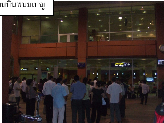
สนามบินพนมเปญ

ที่เกี่ยวข้องกับการท่องเที่ยวก็เป็นอีกธุรกิจหนึ่งที่น่าสนใจในกรุงสีหนุวิลล์ โดยเฉพาะธุรกิจร้านอาหารทะเล ซึ่งควรเน้นการตกแต่งร้านอย่างเป็นเอกลักษณ์ แตกต่างจากรูปแบบเดิมในตลาด ที่ส่วนใหญ่เป็นร้านอาหารทะเลของผู้ประกอบการท้องถิ่น นอกจากนี้ ร้านอาหารตะวันตกก็มีความน่าสนใจมาก เนื่องจากยังมีร้านอาหารประเภทนี้ไม่มากนัก ยิ่งไปกว่านั้น ร้านอาหารประเภท Fast Food และ Food Court ร้านกาแฟ และร้านเบเกอรี่ ก็ได้รับความนิยมเพิ่มขึ้นมากเช่นกัน