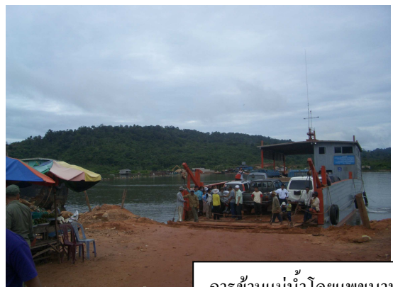
การข้ามแม่น้ำโดยแพขนานยนต์