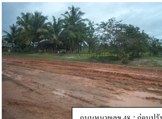
ถนนหมายเลข 48 : ก่อนปรับปรุง

แต่เดิม ถนนหมายเลข 48 เป็นถนนลูกรัง และเป็นทางตัดภูเขา หน้าแล้งพอใช้การได้ แต่หน้าฝนจะมีปัญหาในการใช้เส้นทางอย่างมาก นอกจากนั้น ยังมีแม่น้ำตัดผ่านถึง 4 สาย คือ แม่น้ำตาไต สแรมเบิล อันดงตีก และตราแปงรุ้ง ซึ่งการข้ามแม่น้ำจะต้องใช้แพขนานยนต์ บรรทุกรถได้ครั้งละ 6-10 คัน ใช้เวลาข้ามแม่น้ำประมาณ 5 นาที แต่อาจต้องใช้เวลารอก่อนข้ามนานถึง 1 ชั่วโมง เพราะต้องรอให้รถเต็มจำนวน หรือการจราจรบริเวณท่าเรือติดขัด เนื่องจากรถที่ขึ้นลงอาจติดหล่มบริเวณท่าข้าม