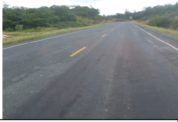
ถนนหมายเลข 48 : หลังปรับปรุง