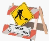
[ระยะสั้น]