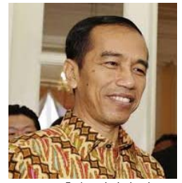
นาย Joko Widodo ว่าที่ประธานาธิบดีคนใหม่ของอินโดนีเซีย

เมื่อวันที่ 21 สิงหาคม 2557 ศาลรัฐธรรมนูญของอินโดนีเซียมีคำวินิจฉัยรับรองผลการเลือกตั้งประธานาธิบดีเมื่อวันที่ 9 กรกฎาคมที่ผ่านมา ซึ่งนาย Joko Widodo หรือ Jokowi ชนะการเลือกตั้ง พร้อมทั้งปฏิเสธคำอุทธรณ์ของอดีตนายพล Prabowo Subianto ผู้สมัครชิงตำแหน่งประธานาธิบดี ซึ่งฝ่ายแพ้การเลือกตั้งและยื่นฟ้องว่ามีการทุจริตการเลือกตั้ง โดยคัดค้านดังกล่าวถือเป็นการชี้ขาด และมีผลผูกพันทางกฎหมาย ซึ่งจะให้นาย Jokowi ขึ้นดำรงตำแหน่งประธานาธิบดีคนใหม่อย่างแน่นอน ในวันที่ 20 ตุลาคมนี้ ทั้งนี้ ทิศทางนโยบายการพัฒนาประเทศภายใต้การนำของนาย Jokowi ในวาระการดำรงตำแหน่ง 5 ปีนับจากนี้ เป็นประเด็นที่ควรติดตามใกล้ชิด เนื่องจากไม่เพียงแต่จะเป็นปัจจัยสำคัญที่กำหนดอนาคตทางเศรษฐกิจของอินโดนีเซีย ยังเป็นทั้งโอกาสและความท้าทายของไทยด้วย