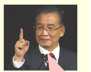
นายกรัฐมนตรี Wen Jiabao ของจีนเรียกร้องให้ทุกฝ่ายเพิ่มความพยายามในการรักษาระดับอัตราการขยายตัวทางเศรษฐกิจ หลังจากเศรษฐกิจจีนส่งสัญญาณชะลอตัวลงต่อเนื่อง

ในช่วงปลายเดือนพฤษภาคม 2555 นายกรัฐมนตรี Wen Jiabao ของจีนส่งสัญญาณกระตุ้นเศรษฐกิจเพิ่มเติม หลังจากจีนเพิ่งปรับลดอัตราการดาร์งเงินสดสำรองของธนาคารพาณิชย์ลง 0.5% ซึ่งเป็นการปรับลดครั้งที่ 3 ในรอบ 6 เดือน เพื่อกระตุ้นการขยายสินเชื่อของธนาคารพาณิชย์ อย่างไรก็ตามสถานะแวดล้อมทางธุรกิจที่ไม่สดใส โดยเฉพาะภาคส่งออกที่ชะลอตัว ไม่จูงใจให้ภาคธุรกิจขยายการลงทุนและขອງเงินสินเชื่อเพิ่มเติม ซึ่งเป็นข้อจำกัดของการใช้มาตรการดังกล่าว ขณะที่ปัญหาเงินเฟ้อสูงในจีนคลี่คลายลงมาก ทำให้นักวิเคราะห์ส่วนใหญ่คาดว่ารัฐบาลจีนจะดำเนินมาตรการกระตุ้นเศรษฐกิจระลอกใหม่เพื่อพยุงการขยายตัวของเศรษฐกิจจีนในช่วงที่เหลือของปี 2555 ผ่านโครงการลงทุนภาครัฐ โดยเฉพาะการลงทุนเกี่ยวกับโครงสร้างพื้นฐานต่างๆ เพื่อกระตุ้นการใช้จ่ายเพื่อการบริโภคและการลงทุนในประเทศโดยตรง อย่างไรก็ตาม เม็ดเงินที่อัดฉีดในครั้งนี้น่าจะไม่มากเท่ากับเมื่อครั้งที่จีนเผชิญวิกฤตเศรษฐกิจในปี 2551 เพื่อไม่ให้เกิดปัญหาหากับระบบเศรษฐกิจจีนในภายหลัง ทั้งนี้ Credit Suisse Group AG คาดว่ามาตรการกระตุ้นเศรษฐกิจจีนครั้งใหม่จะมีมูลค่าราว 1-2 ล้านล้านหยวน ซึ่งจะช่วยลดผลกระทบจากภาคส่งออกที่ชะลอตัวและประคองเศรษฐกิจจีนให้ขยายตัวได้ไม่ต่ำกว่าระดับเป้าหมายที่ 8%