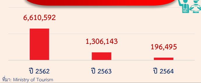
จำนวนนักท่องเที่ยวจากต่างประเทศ (คน)